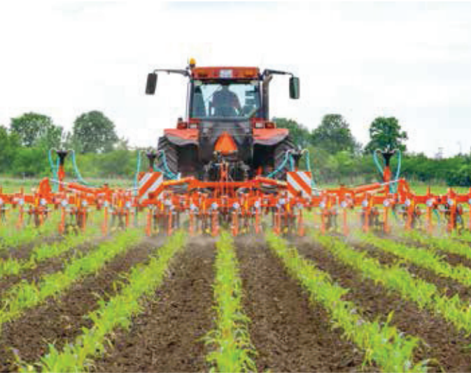
Die Reihenkultur Mais bietet sehr günstige Bedingungen für den Einsatz mechanischer Verfahren zur Unkrautbekämpfung.

Pflanzenschutzmitteln beschrieben, die notwendig ist, um den wirtschaftlichen Anbau der Kulturpflanzen zu sichern. Dabei wird vorausgesetzt, dass alle anderen praktikablen Möglichkeiten zur Abwehr und Bekämpfung von Schadorganismen ausgeschöpft werden. Die Intensität der Anwendung von Pflanzenschutzmitteln kann sehr gut mittels des Merkmals Behandlungsindex dargestellt werden. Im Vergleich zu anderen wichtigen Ackerbaukulturen ist augenfällig, dass Mais den deutlich niedrigsten Behandlungsindex aufweist. Mais ist im Jugendstadium eine konkurrenzschwache Kultur und zudem anfällig gegen Auflaufkrankheiten. Daher zählen die Unkrautbekämpfung sowie ein nachhaltiger und verantwortungsvoller Beizschutz zu den wenigen unabdingbaren Pflanzenschutzmaßnahmen im Maisanbau.