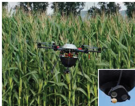
Ausbringung von Trichogammakapseln mit einem GPS-gesteuerten Multikopter.

Während mit diesen Ansätzen in den letzten 10 Jahren signifikante Erfolge im praktischen Maisanbau erreicht werden konnten, ist ein verlässlicher und umfassender Auflaufschutz zurzeit nur mit geeigneten