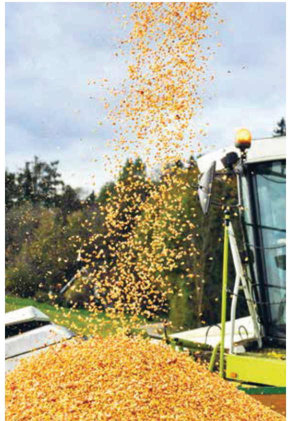
Der Körnermaisertrag ist über die Jahre stetig angestiegen.

Von der gesamten in Deutschland verarbeiteten Körnermaismenge (Erzeugung und Import) geht der überwiegende Teil in die Herstellung von Futtermitteln. Mit der auf den Betrieben für die Fütterung verbliebenen Menge macht dies rund 70 % aus. Fast 20 % gehen mittelbar oder unmittelbar über verarbeitete Stärke in den Nahrungsmittelbereich. Kleinere Mengen