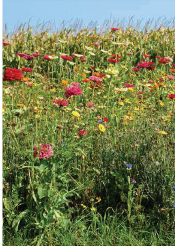
Blühstreifen schaffen zusätzliche Biodiversität und erhöhen die gesellschaftliche Akzeptanz.

Die gesellschaftliche Akzeptanz des Maisanbaus ist geprägt durch die Wahrnehmung von Natur- und Umweltaspekten. Natur und Umwelt sind bestimmende Lebensgrundlagen des Menschen, ihr Schutz ist gleichrangig zu sehen zur Ernährungssicherheit und findet entsprechenden Niederschlag in den Nachhaltigkeitszielen der Vereinten Nationen. Der in der zurückliegenden Dekade starke Anstieg des Maisanbaus in Deutschland wird mit den Wertvorstellungen von Teilen der Zivilgesellschaft als nicht vereinbar angesehen, insbesondere in Regionen mit hohen Maisanteilen. Zudem verstärken die hochaufwachsende Pflanze und die daraus resultierende dominante Optik die Wahrnehmung in der Kulturlandschaft und den Eindruck eines veränderten Landschaftsbildes. Dagegen findet die Funktion von Mais als Rohstoff für die Herstellung hochwertiger Nahrungsmittel und sein sowohl globaler als auch lokaler Beitrag zu zentralen Nachhaltigkeitszielen wie Armutsbekämpfung, Hungerbekämpfung sowie Gesundheit und Wohlbefinden in den gesellschaftlichen Debatten kaum einen angemessenen Niederschlag. Dies zu ändern bedarf eines hohen kommunikativen Aufwands auf wis-